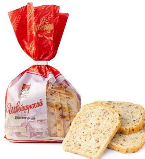
Хлеб Швейцарский, в нарезке. Вес: 0,3 кг