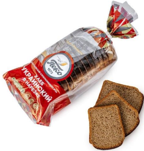
Хлеб Украинский, в нарезке. Вес: 0,65 кг