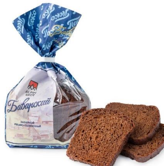
Хлеб Баварский, в нарезке. Вес: 0,3 кг