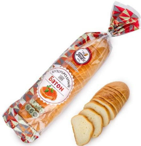
Батон Бутербродный, в нарезке. Вес: 0,4 кг