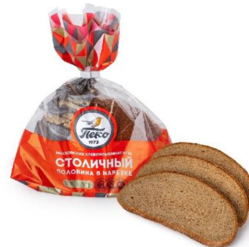
Хлеб Столичный, половинка в нарезке. Вес: 0,325 кг