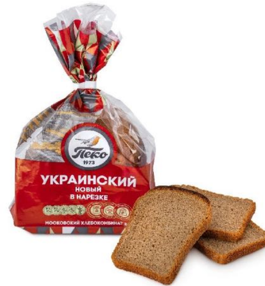
Хлеб Украинский, половинка в нарезке. Вес: 0,325 кг