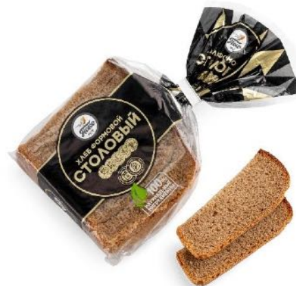
Хлеб Столовый Вес: 0,16 кг