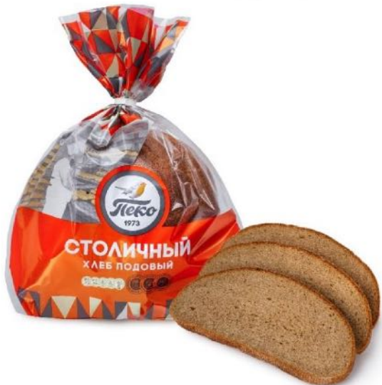
Хлеб Столичный, в нарезке. Вес: 0,65 кг