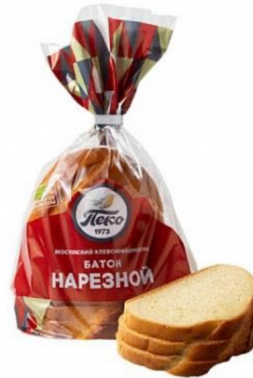
Батон нарезной, половинка в нарезке. Вес: 0,2 кг