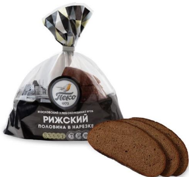
Хлеб Рижский, в нарезке. Вес: 0,325 кг