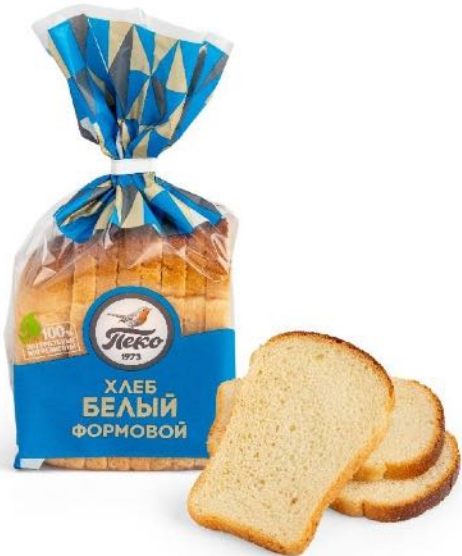
Хлеб Белый формовой Вес: 0,25 кг