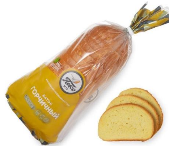
Батон Горчичный, в нарезке. Вес: 0,4 кг