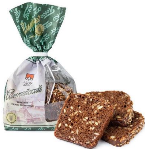
Хлеб Альпийский, в нарезке. Вес: 0,3 кг