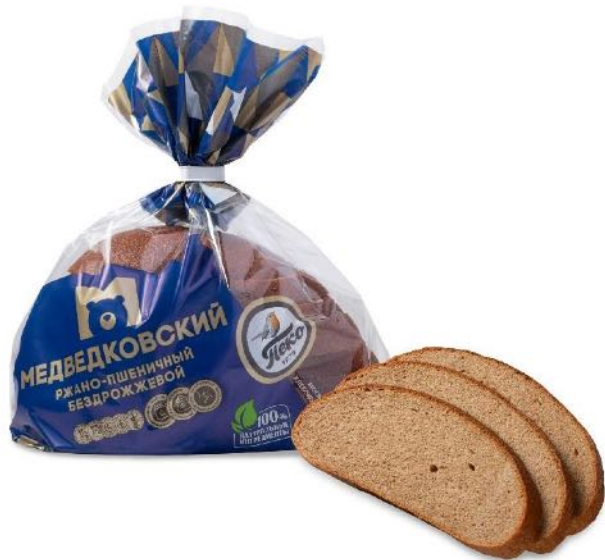
Хлеб Медведковский, в нарезке. Вес: 0,3 кг