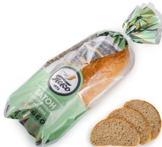
Батон с отрубями Вес: 0,3 кг