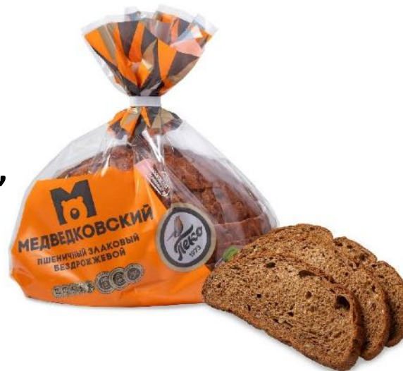
Хлеб Медведковский злаковый, в нарезке. Вес: 0,3 кг