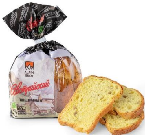
Хлеб Австрийский, в нарезке. Вес: 0,2 кг