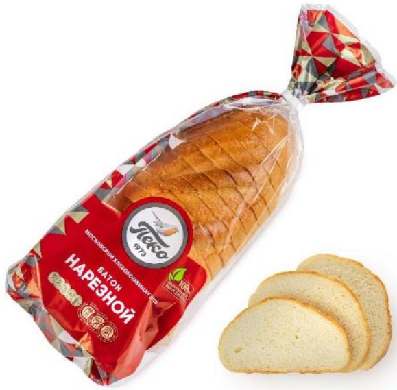
Батон нарезной, в нарезке. Вес: 0,4 кг