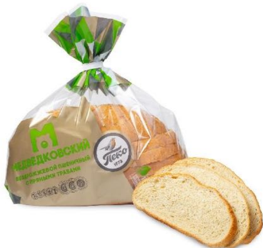
Хлеб Медведковский с пряными травами в нарезке. Вес: 0,3 кг