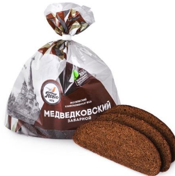
Хлеб Медведковский, в нарезке. Вес: 0,375 кг