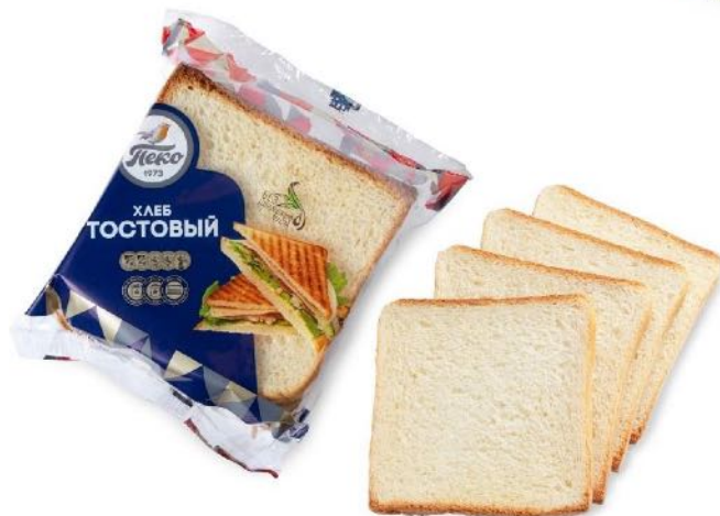
Хлеб Тостовый Вес: 0,17 кг