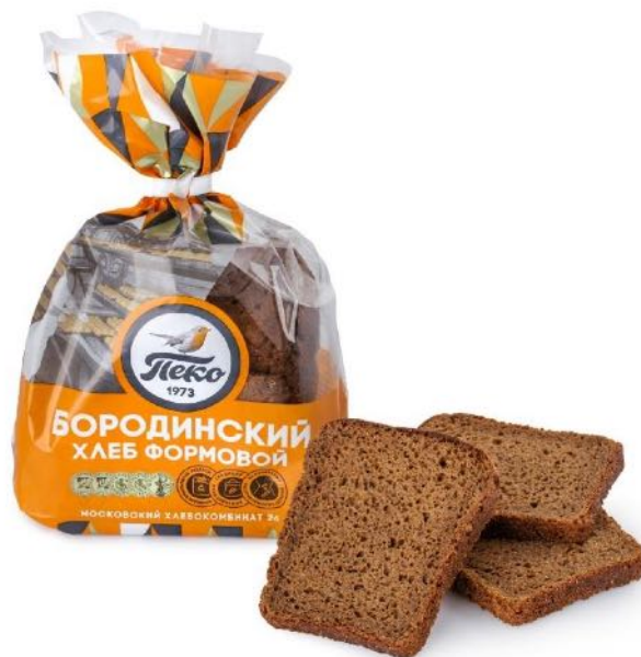
Хлеб Бородинский, в нарезке. Вес: 0,35 кг