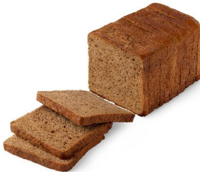
Хлеб Тостовый Вес: 0,55 кг