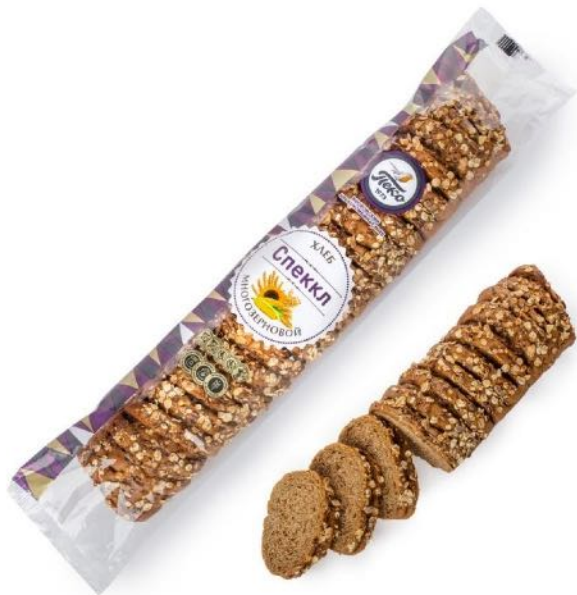
Хлеб Спеккл Вес: 0,3 кг